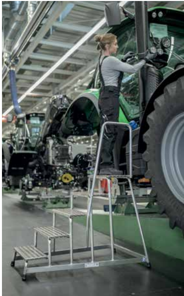
Abb. Bestell-Nr. 50045